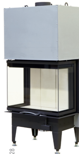
64x33x51 S3 2.0 - Art. no. 360128